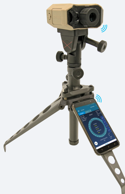
Montré en mode Bluetooth actif