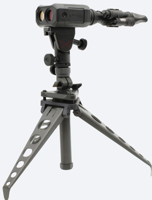
Montré en configuration de vision nocturne